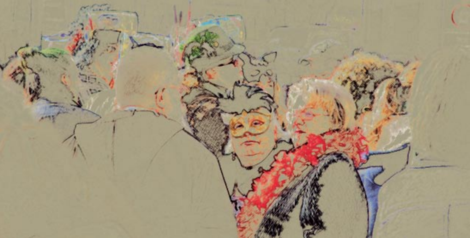
Die lustige Jahreszeit 2008, Druck auf Leinwand, 80 x 40 cm