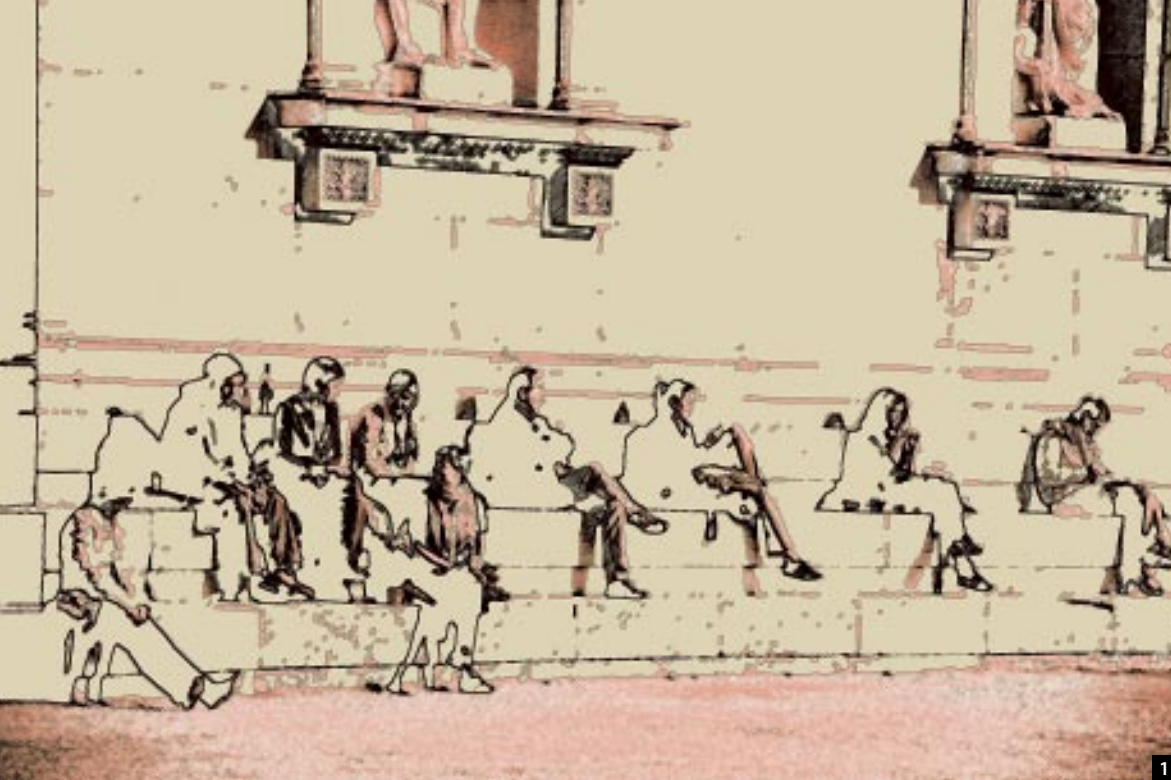
1 Neun Könige 2008, Druck auf Leinwand, 120 x 80 cm